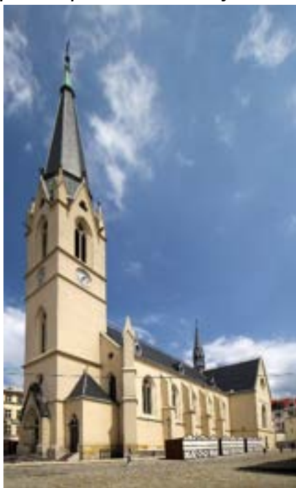
Liberecký kostel sv. Antonína.

Musel jsem. Jinak bych asi stěžil pak někdy mluvil o Abrahámovi, který se ve svých 75 letech vydal z Chaldejského Uru do Kanaanu. To, zač se taky v těchto dnech hodně modlím, jsou moji zdejší farníci. Je mi jich líto. Byli ke mně tak laskaví a obětaví. Teď, když je opouštím, připadám si jako otec, který utíká od svých dětí. Bojím se, abych nebyl posledním duchovním správcem na Slivici.