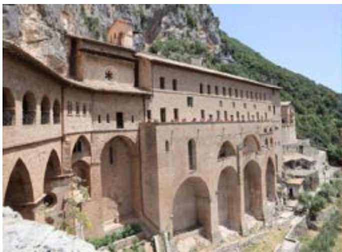
Klášter u Subiacu, v místě jeskyně sv. Benedikta.

Stabilitas loci neboli základem je jedno místo, mnich je po celý život spojen (pokud neemigruje jako Anastáz Opasek) s jedním klášterem, tělo i po smrti zůstává v blízké klášterní hlíně. Je potřeba zapustit kořeny, prožívat vazby, být tu pro druhé. Klášterní zdi