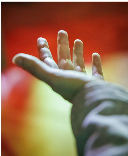
Ilustrační foto.

Stání. Stání je jedním z běžných postojů toho, kdo se modlí. Na starodávných křesťanských freskách